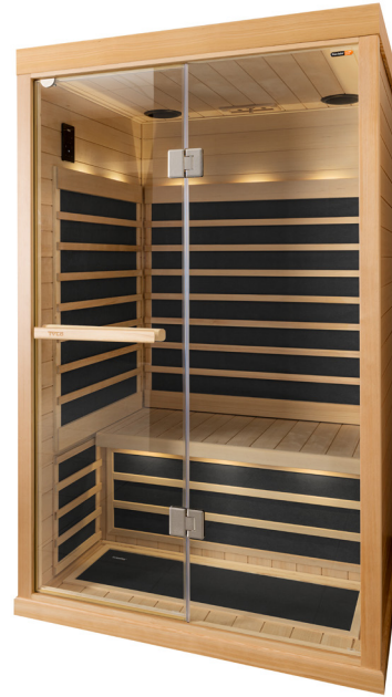
Cabine Infra T-820 Black